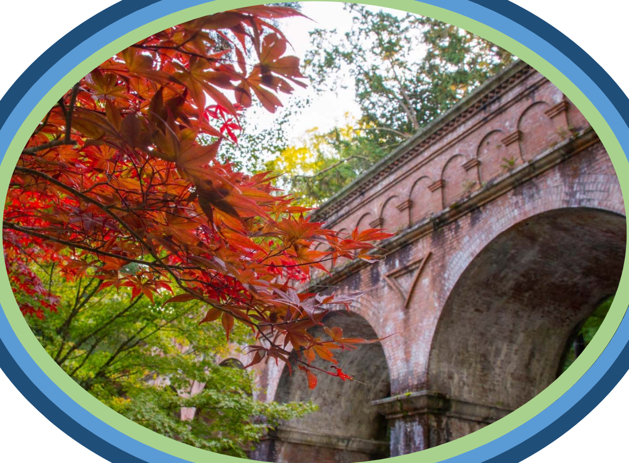
京都 南禅寺 水路閣